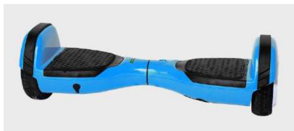
图 2 锐哲 Hovertrax

骑客就国内产业要求的技术方面进行了抗辩。在技术方面，原告需证明其国内产品利用了专利权利要求中的一项或多项。骑客指出，原告的“Hovertrax”产品没有利用权利要求 1，国内产业要求的技术方面不能得到满足，因此这起 337 调查缺乏基础，请求 ITC 终止调查。